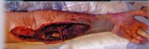
Рис. 3. Газовая гангрена левой верхней конечности после введения "Кокаина" в кубитальную вену.